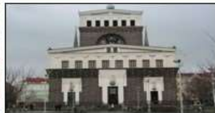
Cerkev Sv. Srca Jezusovega, Praga