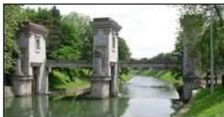
Zapornica na Ljubljanici