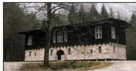
Lovska kočja kralja Aleksandra v Kamniški Bistrici