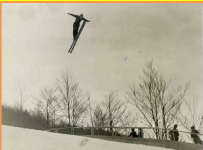
Skoki v Planici – Bloudkova velikanka