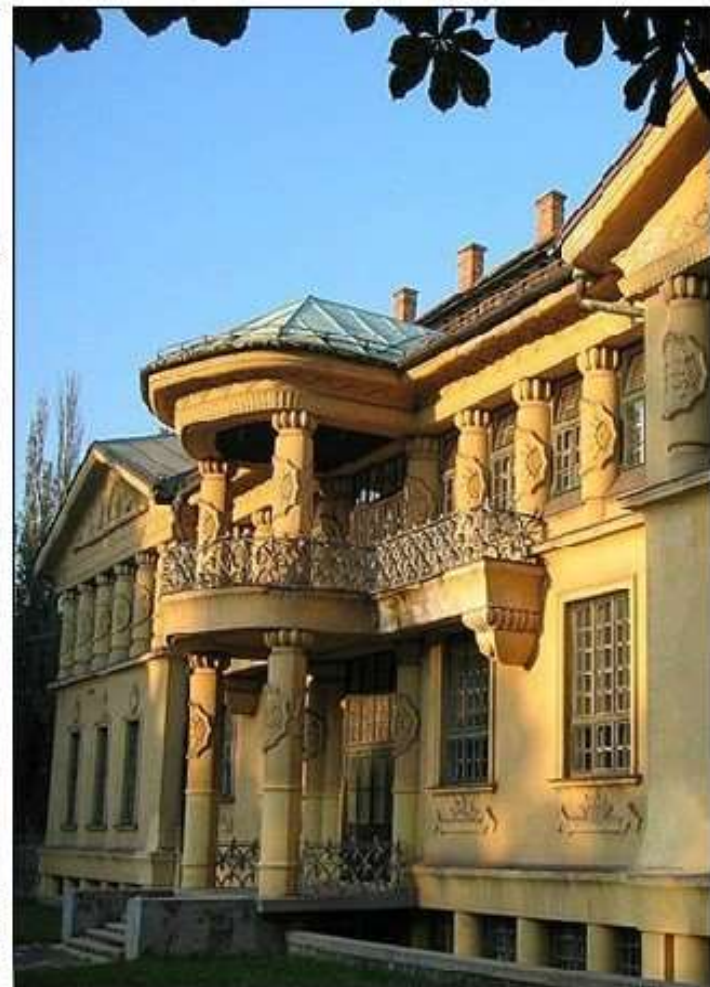
Vurnikov Sokolski dom in Združena gospodarska zbornica v Ljubljani