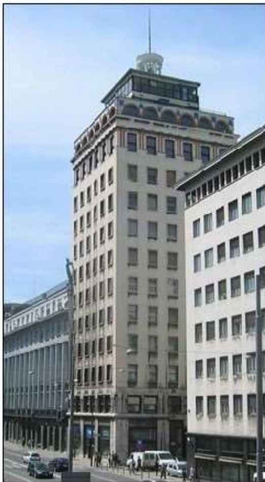
Leta 1933 je bil zgrajen 70 metrov visok ljubljanski Nehotičnik, ki ga je projektiral slovenski arhitekt Vladimir Šubic