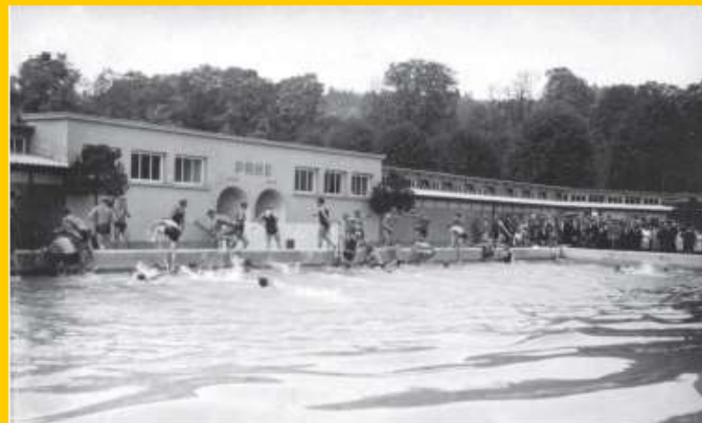
Med Ljubljancani so bila v poletnih dneh zelo priljubljena kopališča na Savi in Ljubljanci ter bazena na prostem – Kolezija in Ilirija (na sliki).