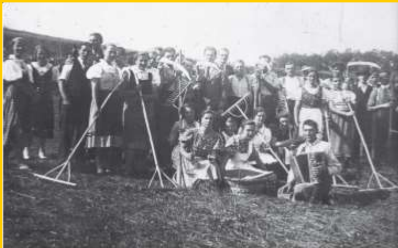
Kmečke zveze so prirejale številna tekmovanja. Na sliki so udeleženci ene od tekem koscev in grabljic (1938).

Ob začetku druge svetovne vojne so kmetje predstavljali polovico prebivalstva, delavci eno tretjino , najmanjši je bil delež meščanov .