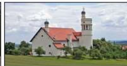
Cerkev gospodovega vnebohoda v Prekmurju