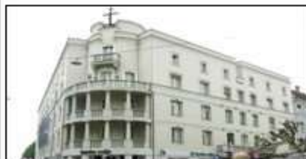
Ljudska posojilnica, Celje