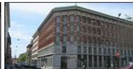
Zavarovalnica Triglav, Ljubljana