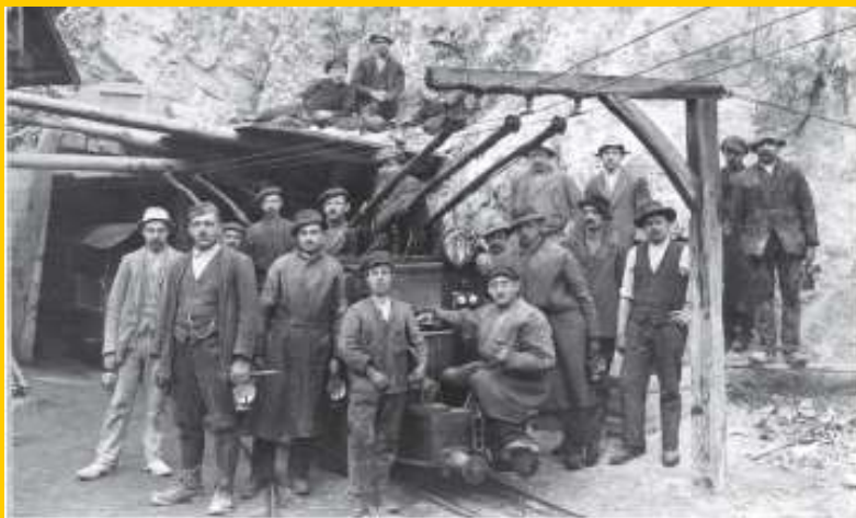
Zasluzki v rudarstvu so ob gospodarski krizi v 30. letih zelo padli. Družine rudarjev so zelo težko živele in bile večkrat lačne.

Ob začetku druge svetovne vojne so kmetje predstavljali polovico prebivalstva, delavci eno tretjino , najmanjši je bil delež meščanov .