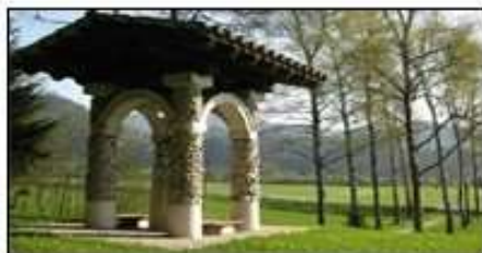
Spomenik padlim, Selška dolina