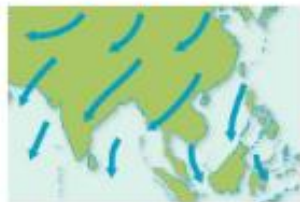
Zimski monsun 138